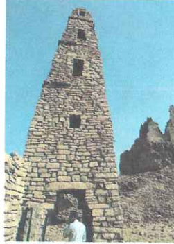
منذنة مسجد عمر في دومة الجندل